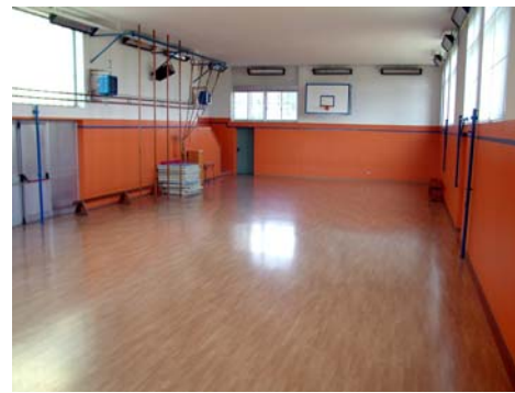
Palestra scuole - Pavimentazione tinteggiatura e nuovi impianti