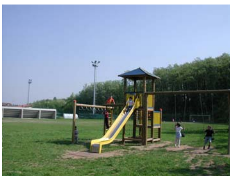
Centro Sportivo Campo e parco giochi attrezzato