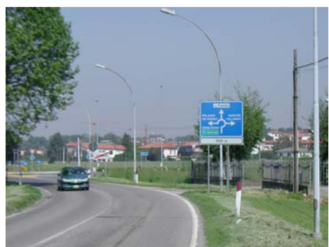
Via De Gasperi / Via Milano - Rotatoria e messa sicurezza incrocio