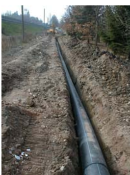
Via Petrarca Collettore consortile