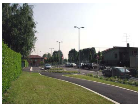
Collegamento Via Volta / IV Novembre Nuova viabilità, parcheggi e verde