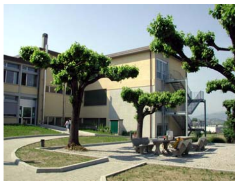
Scuola Elementare - Scala antincendio e nuovo ingresso