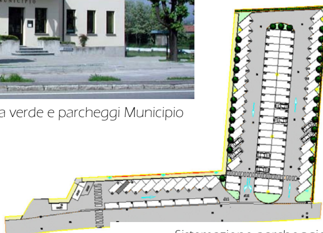
Sistemazione parcheggio Via Fleming - FNM