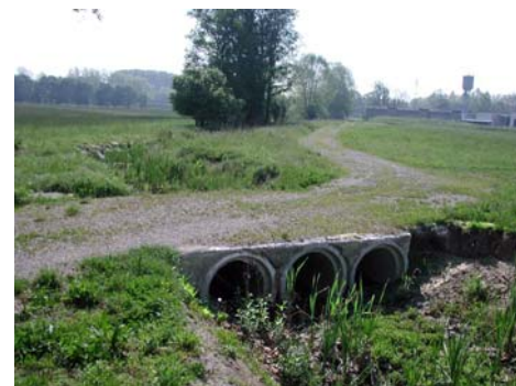
Loc. Fontanino Collettore fognatura e tombinatura