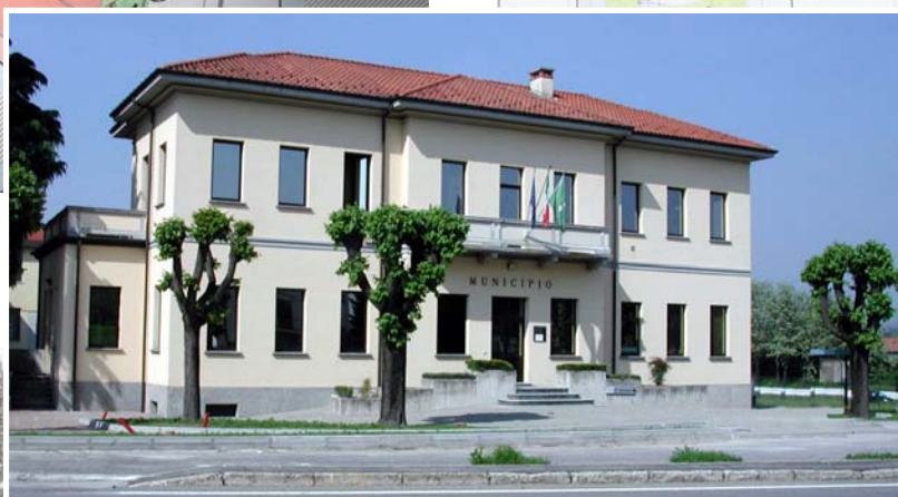
Sistemazione area verde e parcheggi Municipio