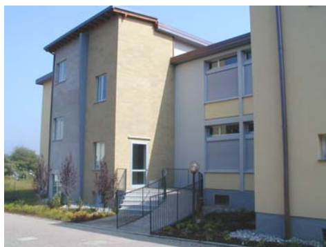
Scuola Elementare - Ascensore e rampa disabili