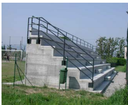
Centro Sportivo - Tribuna calcio e panchine giocatori