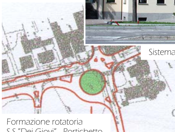
Formazione rotatoria S.S. "Dei Giovi" - Portichetto