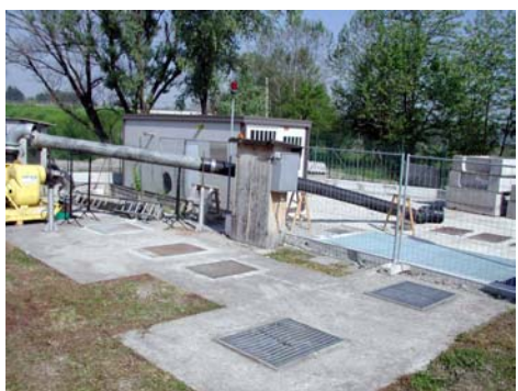
Via Petrarca Stazione di sollevamento