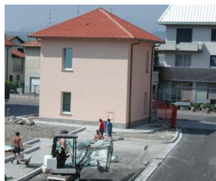
Centro Civico Via Volta Biblioteca e sala riunioni