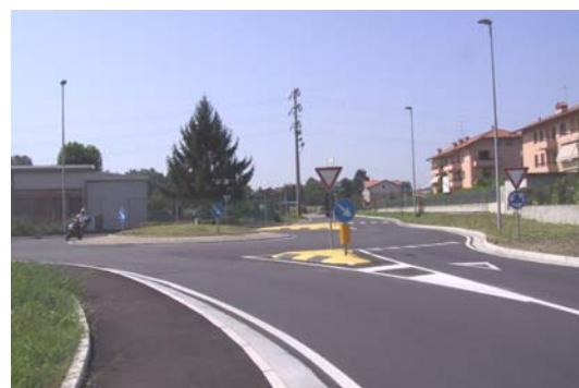
Via IV Novembre Rotatoria e viabilità residenziale